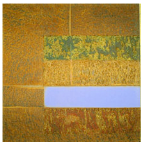
2006 / 2008, je 50 x 50 cm