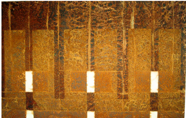
2012, Oxydation auf Baumwolltextil, 91 x 140 cm