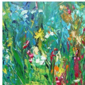
2020, „Biotransformation“, Öl/Lw. 70 x 70cm