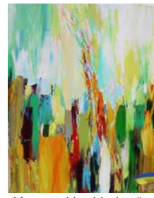
„Karneval im Herbst“, 2021, Öl/Lw, 60x50 cm