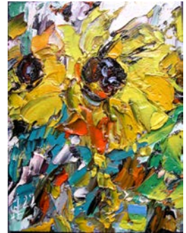
2022, „Sonnenblume“ Öl/Spanplatte, 20 x 15 cm