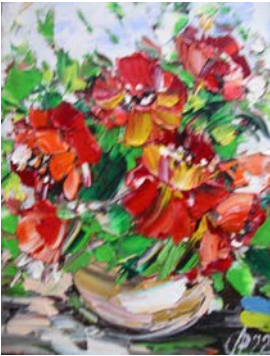
2022, „Frische von Mohn“, Öl/Lw-platte, 25,4 x 20,4 cm