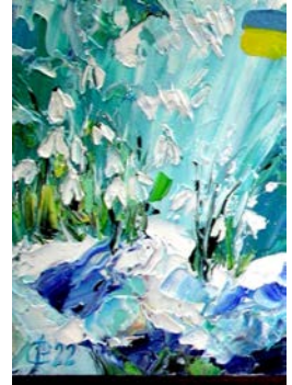
2022, „Frühlingsbewusstsein“, Öl/Spanpl., 20 x 15 cm