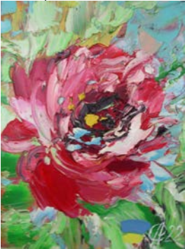
2022, „Sommergefühle“ „Öl/Spanpl., 20 x 15 cm