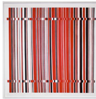
o.T., 1999, Acryl(Lw., 150x150 cm