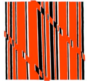
o.T., 1999, Acryl/Lw., 60x60 cm