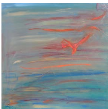
"Meine Worte sind Vögel", 2010, Acryl/Lw., 80 x 80 cm