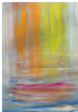
"When joy returns", 2017, Acryl/Collage/LW. 100 x 70