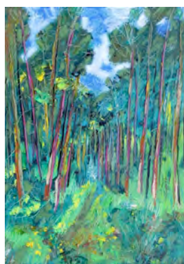
"Wald 1", Goluchow, 2013, Öl/Lw., 100 X 70 cm