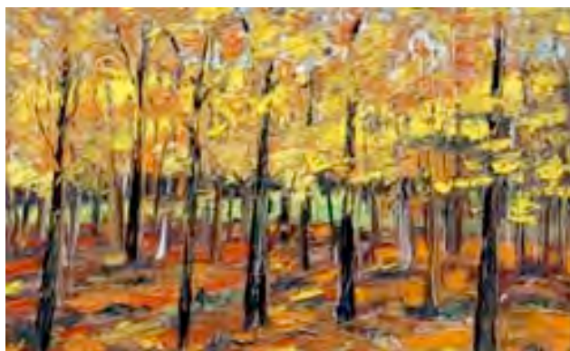
"Roter Herbst", bei Leibach, 2013, Öl/Lw., 60 X 100 cm