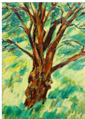
"Eiche 3", Bad Berleburg 2010, Öl/Lw., 100 X 70 cm