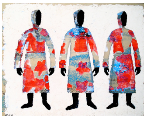
Bauern nach Malewitsch